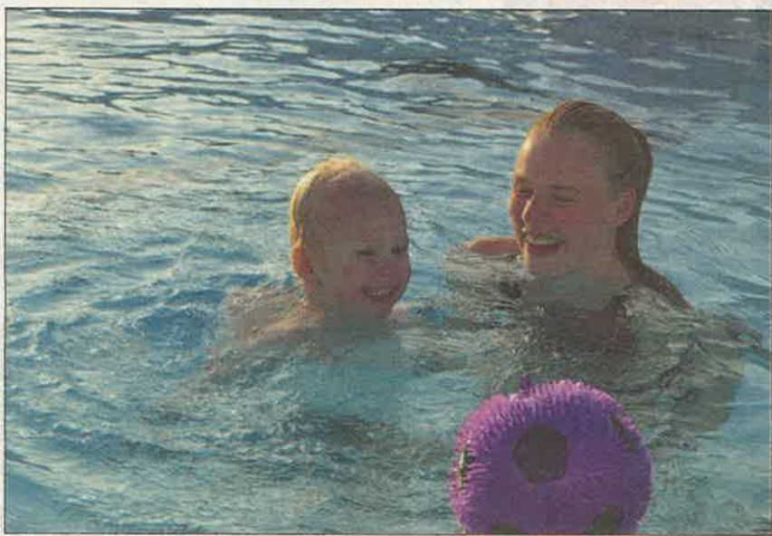
12.500 gæster købte sidste år billet til Brørup Svømmebad, og det bragte 2014 i top 5 blandt de mest besøgte i nyere tid.

– Det er lykkedes at blive klar til sæsonstart med både bassiner, øvrige bygninger og grønne områder hvert år de sidste 59 år – så det lykkedes også i år. I kan godt begynde at glæde jer til jubilæumssæsonen.