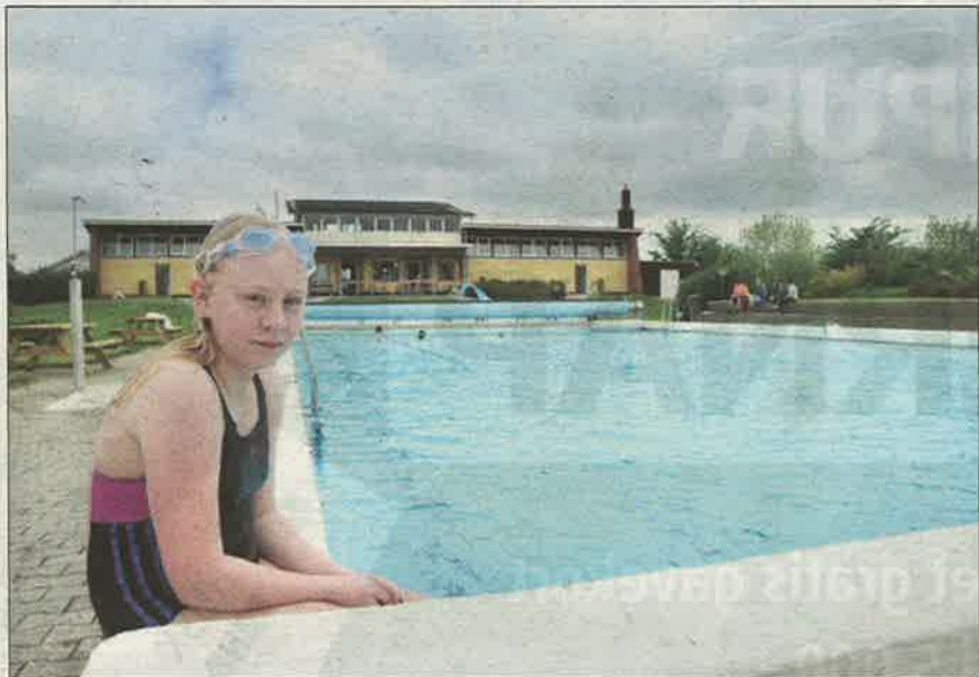
Badegæsterne stod ikke ligefrem i kø i det kølige forårsvejr, da friluftsbadet åbnede i går. Faktisk stod der slet ingen! Op ad dagen kom der dog en håndfuld vikinger.